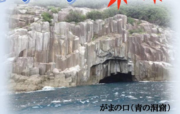
がまの口(青の洞窟)