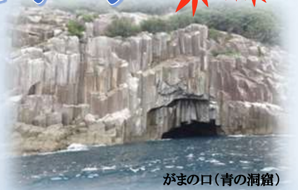
がまの口(青の洞窟)